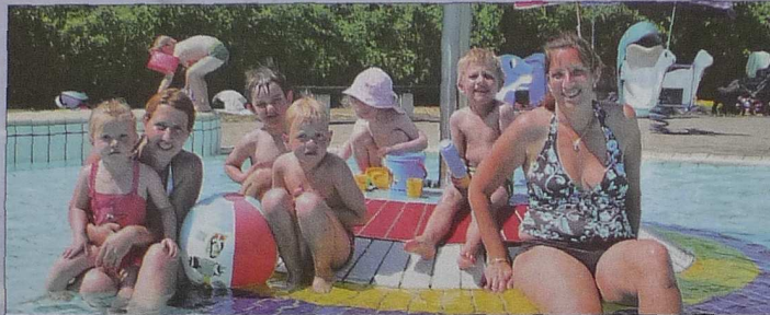
Familientag mit Kind und Kegel - Planschen lässt es sich hier doch besonders gut.