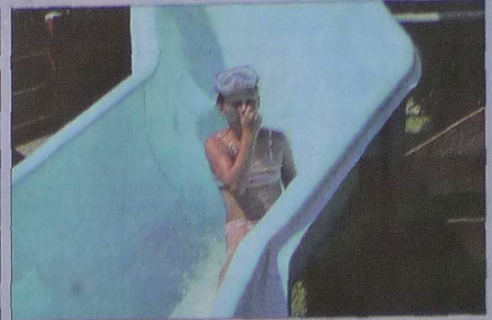
Nase zu und runter geht's die Rutsche.

Wasserspaß bei sommerlich heißen Temperaturen: