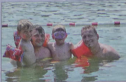
Gemeinsam mit den Kindern die herrliche Abkühlung genießen.