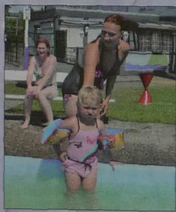
Für die kleinen Wasseratten.