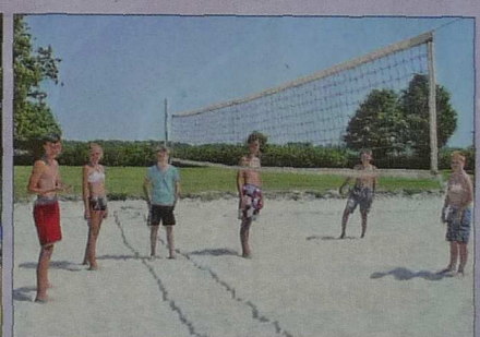
Beachvolleyball direkt am kühlen Wasser.