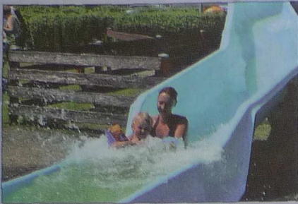
Mit Mama macht die Abfahrt doch am meisten Spaß.